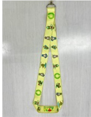
ネックストラップ