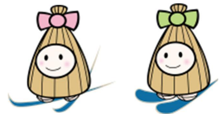
飯山市 PR キャラクター「いいやま雪ん子」